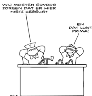
FOKKE & SUKKE ZIJN SUCCESVOLLE PREVENTIEMEDEWERKERS

Vaak is de rol van preventiemedewerker een taak die iemand doet naast andere taken binnen het bedrijf. Dat is een eenmanspost waarbij het helpt als je van tijd tot tijd kunt sparren met anderen die voor een vergelijkbare uitdaging staan. Hoe pakken andere bedrijven het aan? Hierin voorziet het Arboprogramma van de Technische Groothandel.